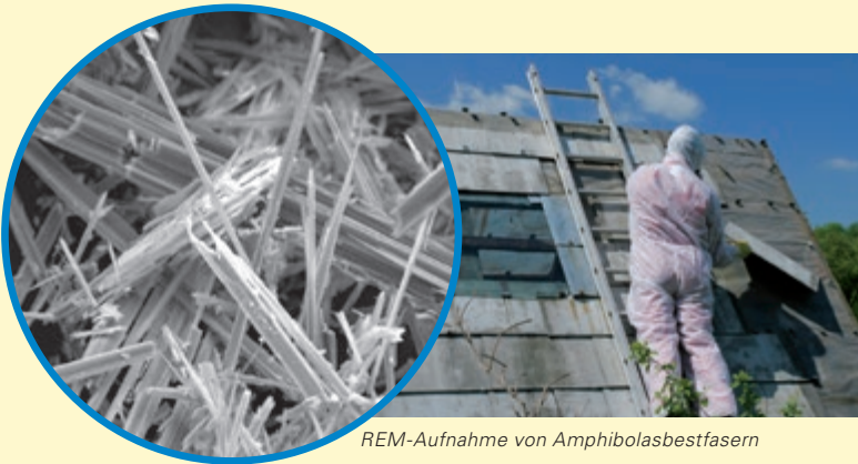
REM-Aufnahme von Amphibolasbestfasern

Trotz Verwendungsverbot sterben in Deutschland nach wie vor Menschen an den Folgen asbestbedingter Krankheiten, weil sie bei Tätigkeiten mit Asbest Fasern eingeatmet haben. Zwischen der Schädigung der Lunge und dem Ausbruch der Krankheit können Jahrzehnte vergehen.